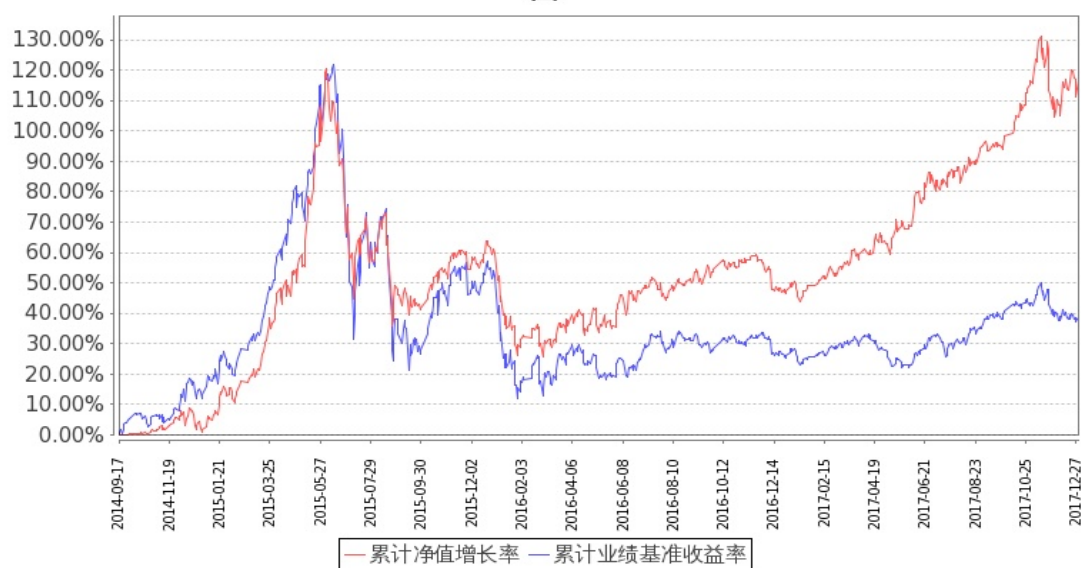
图：嘉实新兴产业股票型证券投资基金份额累计净值增长率与同期业绩比较基准收益率的历史走势对比图