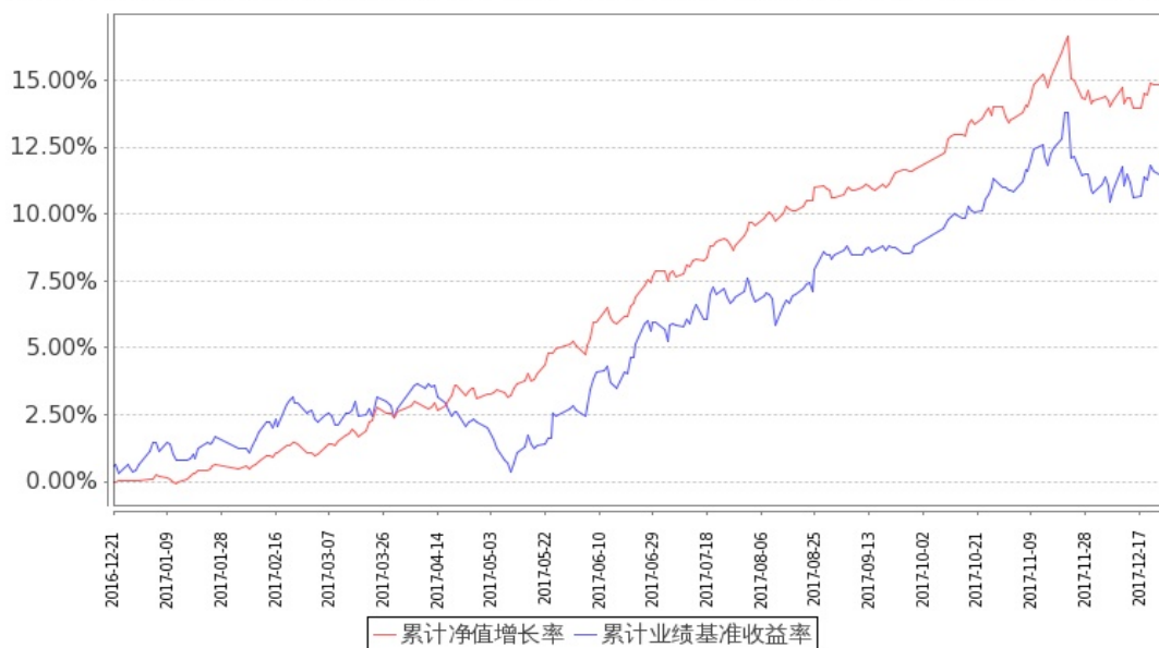
图：嘉实新添瑞混合基金份额累计净值增长率与同期业绩比较基准收益率的历史走势对比图 (2016年12月21日至2017年12月31日)

注：按基金合同和招募说明书的约定，本基金自基金合同生效日起6个月内为建仓期，建仓期结束时本基金的各项投资比例符合基金合同（十二（二）投资范围和（四）投资限制）的有关约定。