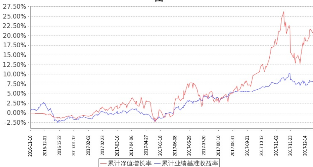
图：嘉实成长增强混合基金份额累计净值增长率与同期业绩比较基准收益率的历史走势对比图 (2016 年 11 月 10 日至 2017 年 12 月 31 日)

注：按基金合同和招募说明书的约定，本基金自基金合同生效日起 6 个月内为建仓期，建仓期结束时本基金的各项投资比例符合基金合同（十二（二）投资范围和（四）投资限制）的有关约定。