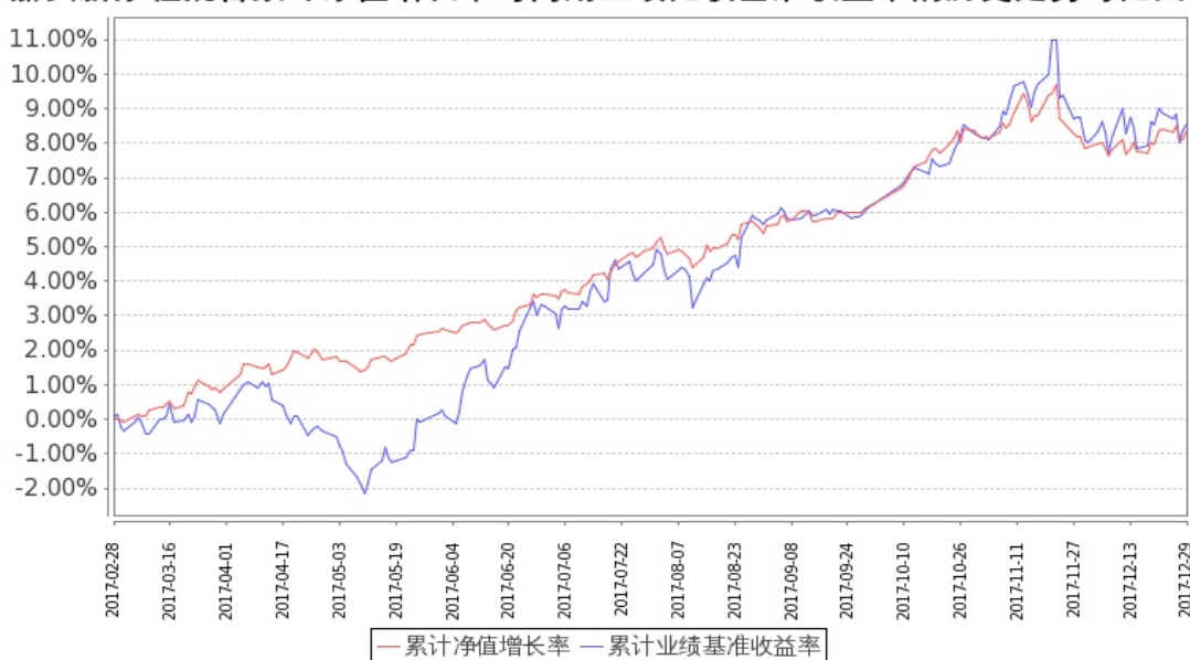
图: 嘉实新添程混合基金份额累计净值增长率与同期业绩比较基准收益率的历史走势对比图