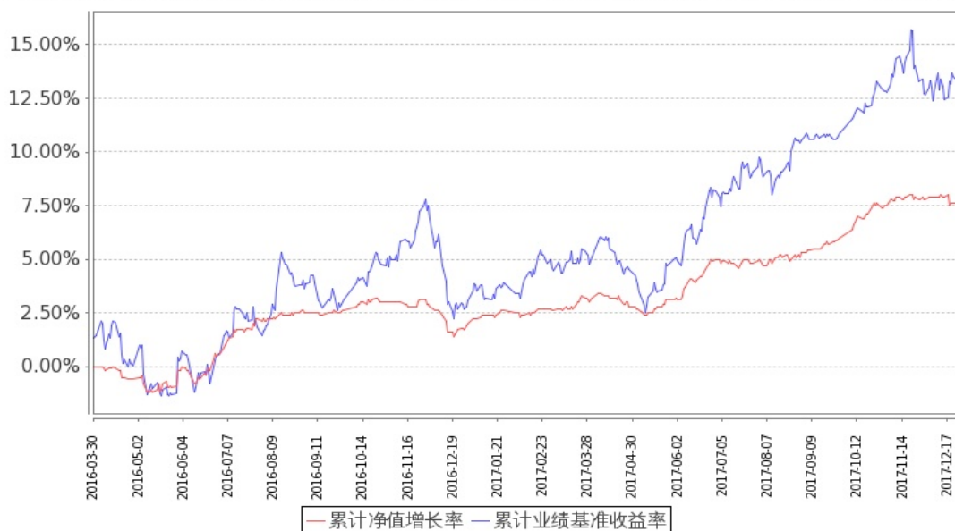
图 1：嘉实新常态混合 A 基金份额累计净值增长率与同期业绩比较基准收益率的历史走势对比图 (2016 年 3 月 30 日至 2017 年 12 月 31 日)