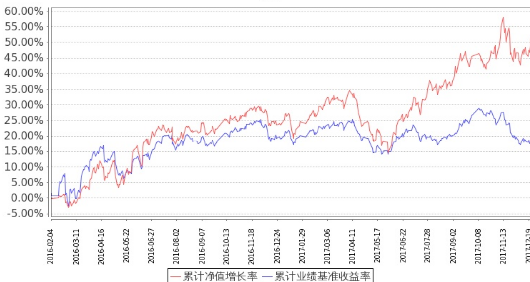
嘉实智能汽车股票累计净值增长率与同期业绩比较基准收益率的历史走势对比图

图：嘉实智能汽车股票基金份额累计净值增长率与同期业绩比较基准收益率的历史走势对比图