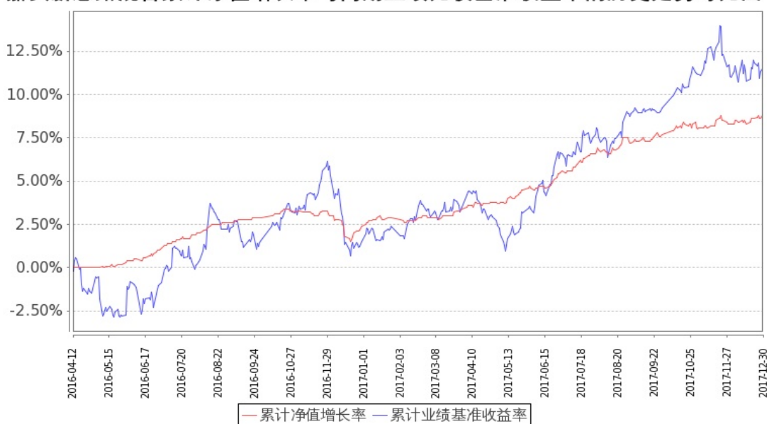
图: 嘉实新思路混合基金份额累计净值增长率与同期业绩比较基准收益率的历史走势对比图