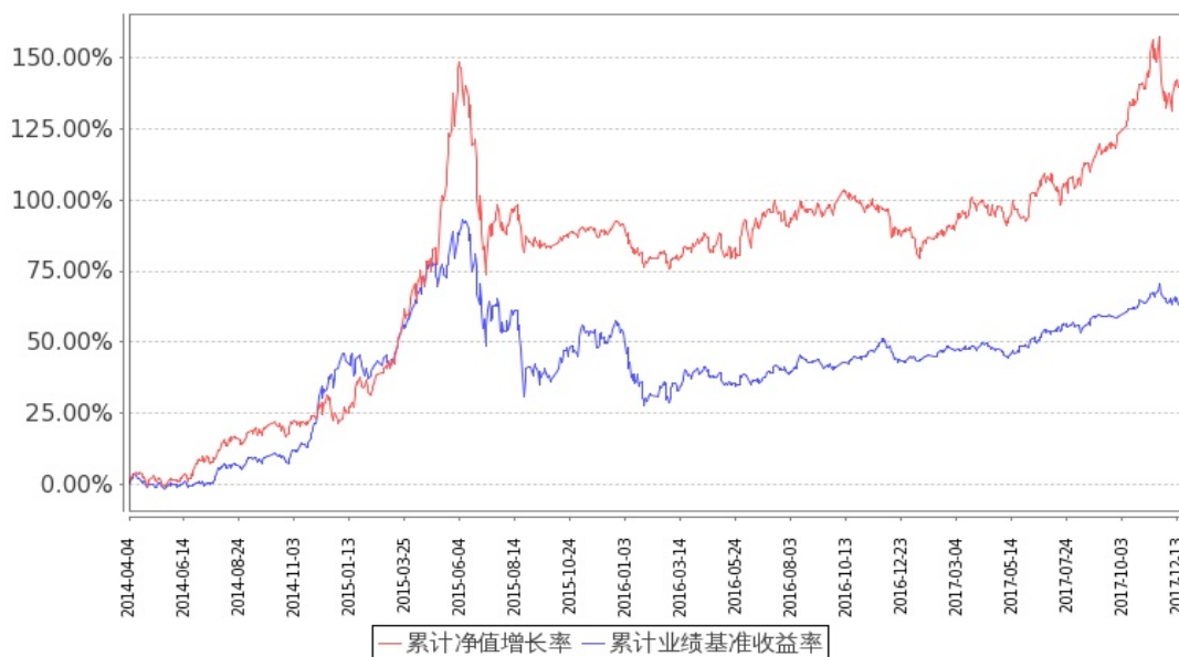
图：嘉实泰和混合基金份额累计净值增长率与同期业绩比较基准收益率的历史走势对比图 (2014 年 4 月 4 日至 2017 年 12 月 31 日)