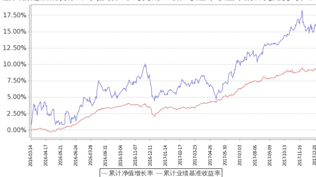
图：嘉实新起航混合基金份额累计净值增长率与同期业绩比较基准收益率的历史走势对比图