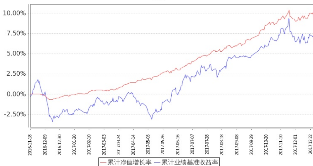
图：嘉实策略优选混合基金份额累计净值增长率与同期业绩比较基准收益率的历史走势对比图 (2016年11月18日至2017年12月31日)

注：（1）按基金合同和招募说明书的约定，本基金自基金合同生效日起6个月内为建仓期，建仓期结束时本基金的各项投资比例符合基金合同（十二（二）投资范围和（四）投资限制）的有关约定。