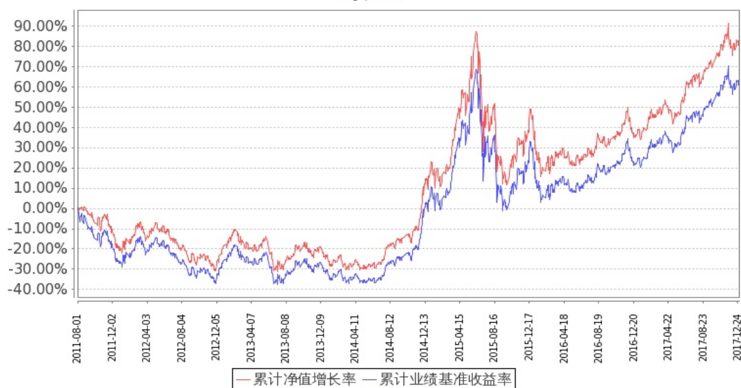
图：嘉实深证基本面 120ETF 基金份额累计净值增长率与同期业绩比较基准收益率的历史走势对比图