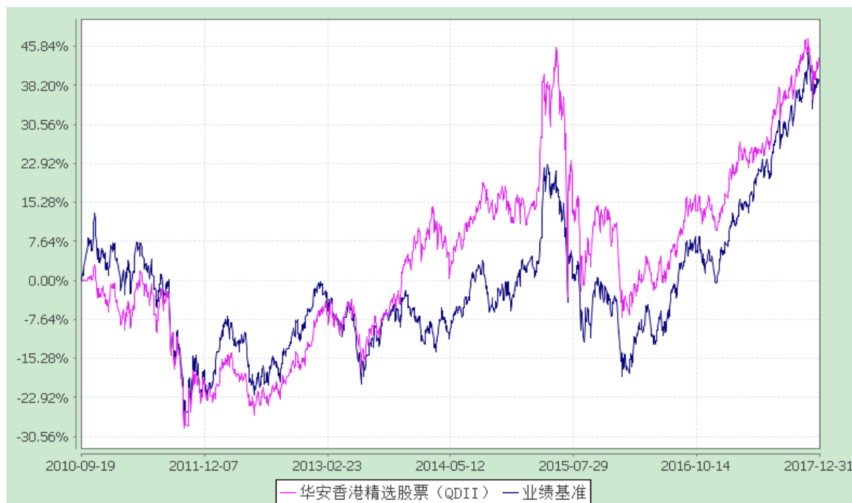
华安香港精选股票型证券投资基金 自基金合同生效以来份额累计净值增长率与业绩比较基准收益率历史走势对比图 (2010年9月19日至2017年12月31日)