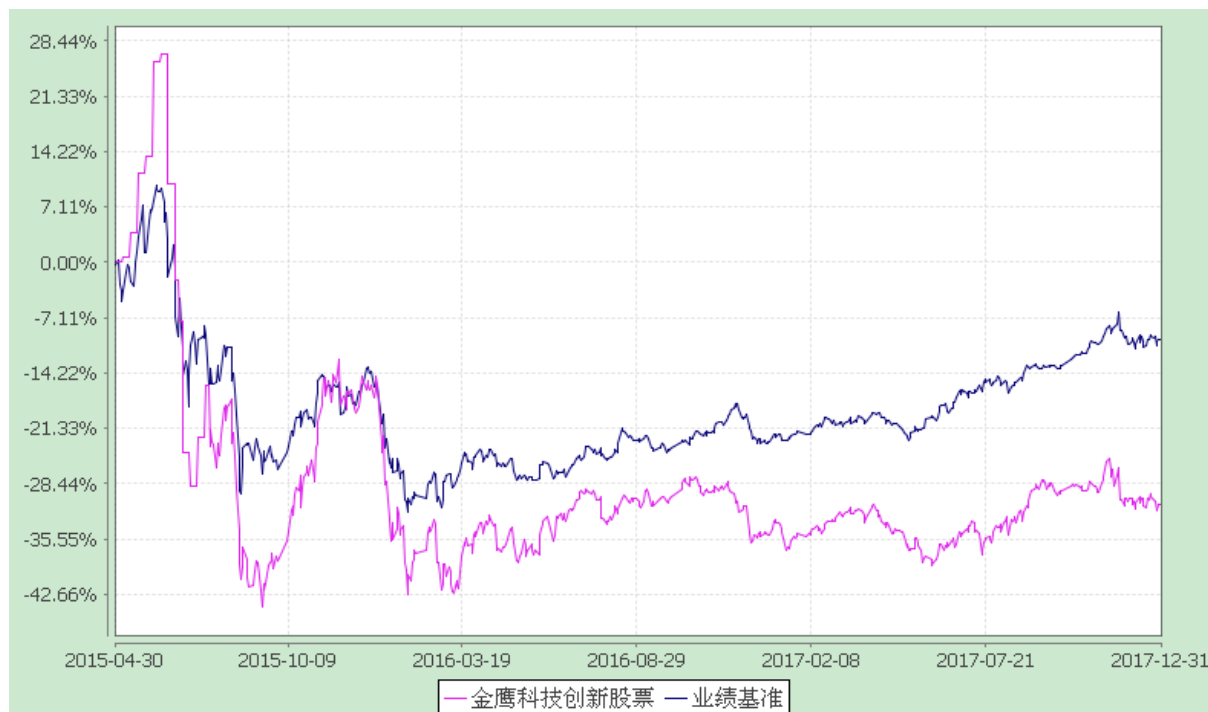
份额累计净值增长率与业绩比较基准收益率的历史走势对比图 (2015 年 4 月 30 日至 2017 年 12 月 31 日)