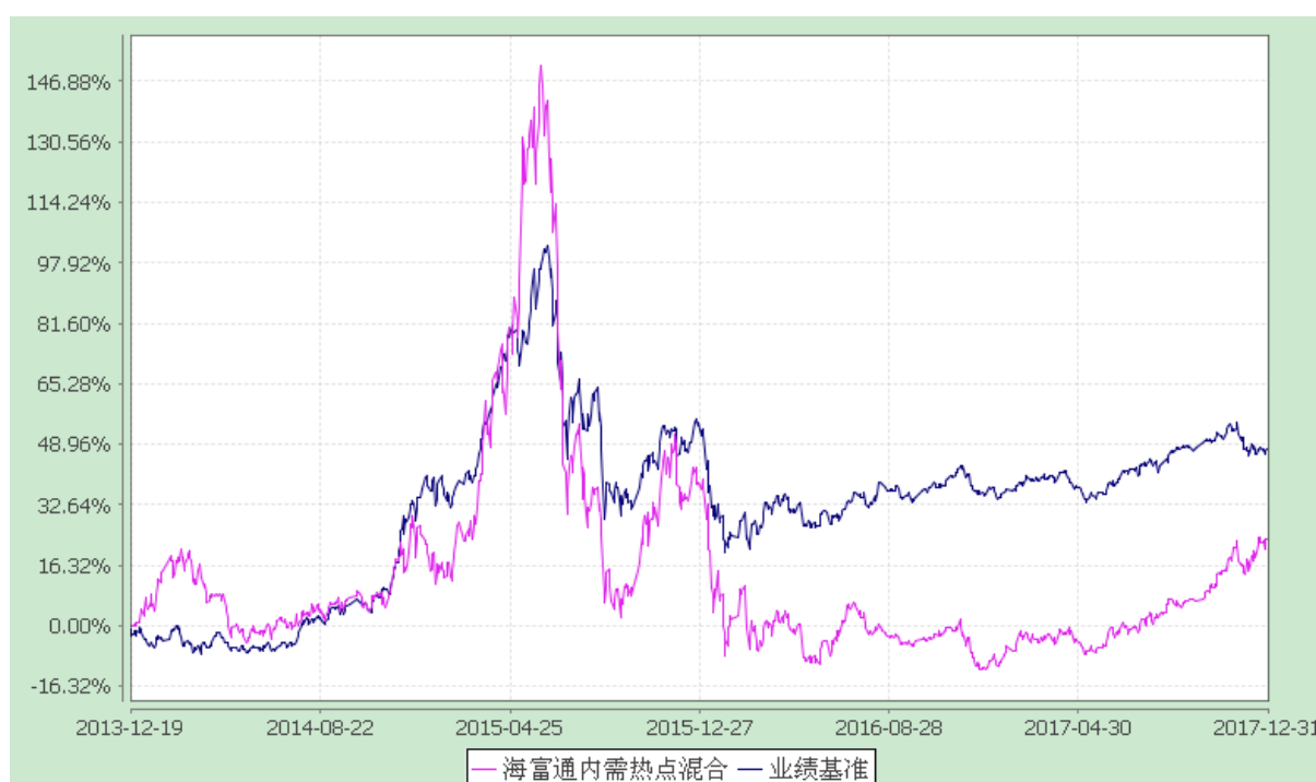
海富通内需热点混合型证券投资基金 份额累计净值增长率与业绩比较基准收益率的历史走势对比图 (2013 年 12 月 19 日至 2017 年 12 月 31 日)

注：按基金合同规定，本基金自基金合同生效起 6 个月内为建仓期，建仓期结束时本基金的各项投资比例已达到基金合同第十二部分（二）投资范围、（五）投资限制中规定的各项比例。