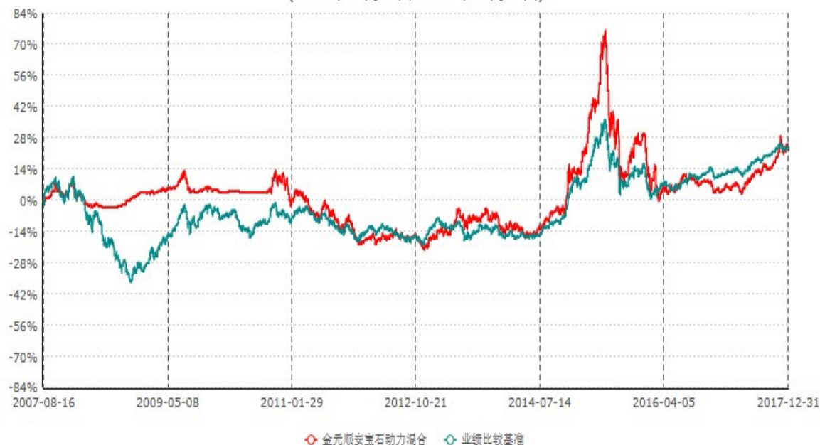
金元顺安宝石动力混合型证券投资基金累计净值增长率与业绩比较基准收益率历史走势对比图 (2010年10月01日-2017年12月31日)