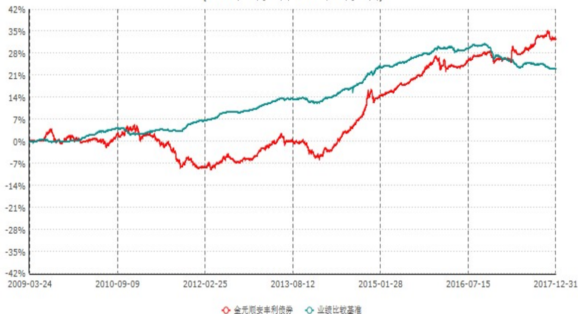
金元顺安丰利债券型证券投资基金累计净值增长率与业绩比较基准收益率历史走势对比图 (2009年03月23日-2017年12月31日)