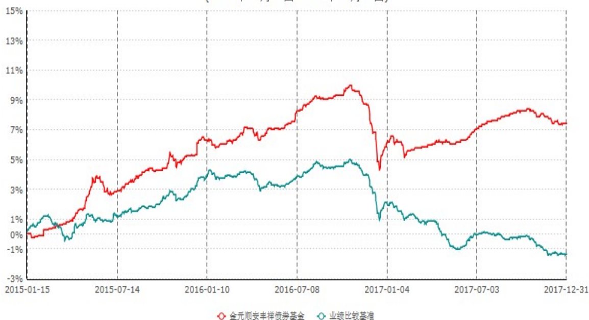
金元顺安丰祥债券型证券投资基金累计净值增长率与业绩比较基准收益率历史走势对比图 (2015年01月14日-2017年12月31日)