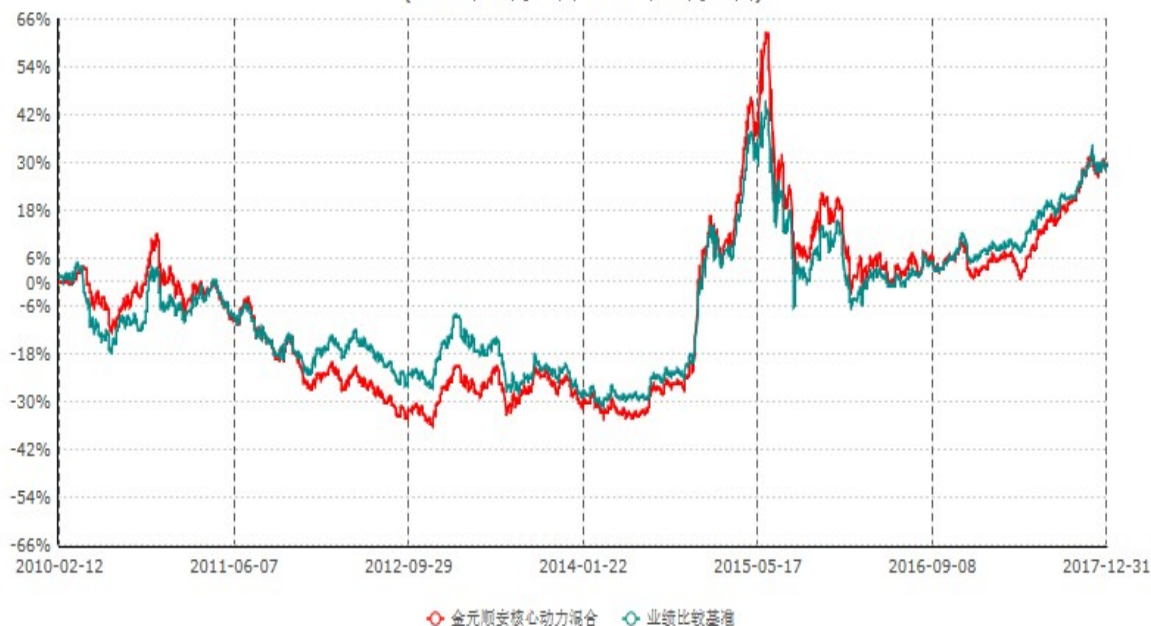
金元顺安核心动力混合型证券投资基金累计净值增长率与业绩比较基准收益率历史走势对比图 (2010年02月11日-2017年12月31日)