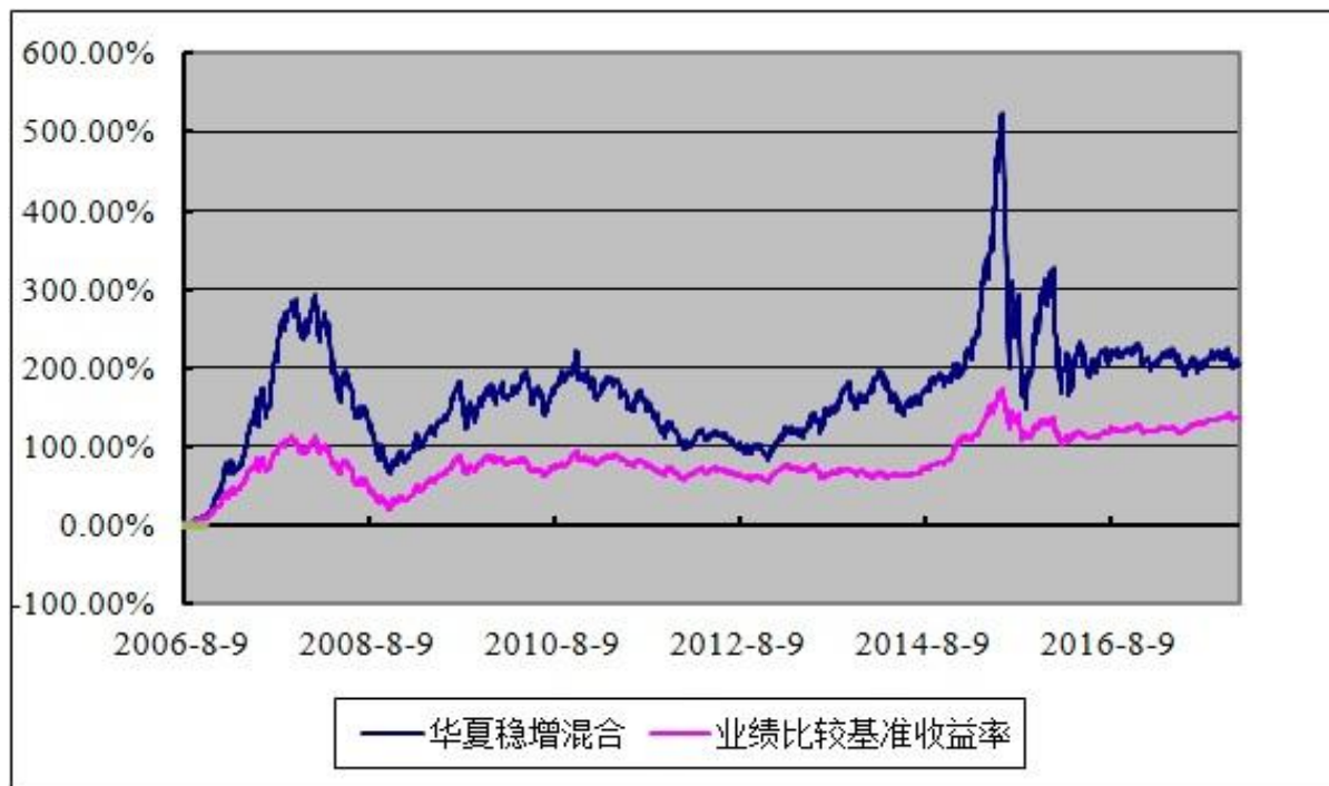
份额累计净值增长率与业绩比较基准收益率的历史走势对比图 (2006 年 8 月 9 日至 2017 年 12 月 31 日)

注：自 2006 年 8 月 9 日起，由《兴业证券投资基金基金合同》修订而成的《华夏平稳增长混合型证券投资基金基金合同》生效。