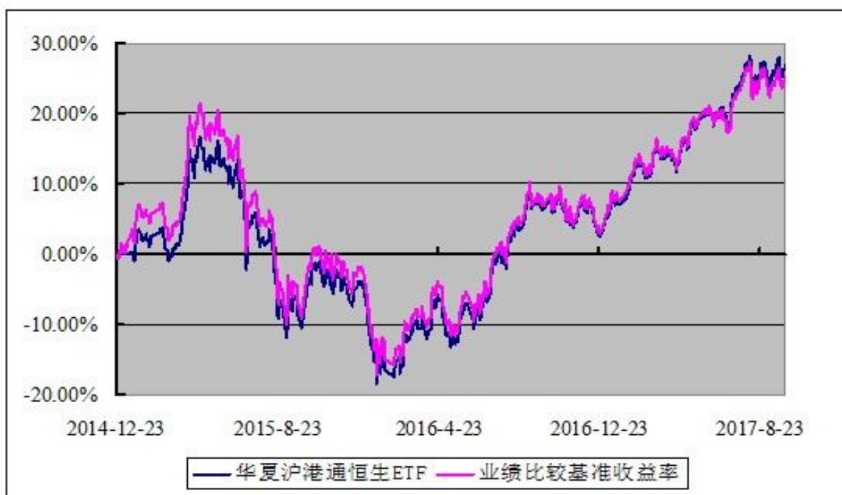
华夏沪港通恒生交易型开放式指数证券投资基金 份额累计净值增长率与业绩比较基准收益率历史走势对比图 (2014 年 12 月 23 日至 2017 年 12 月 31 日)