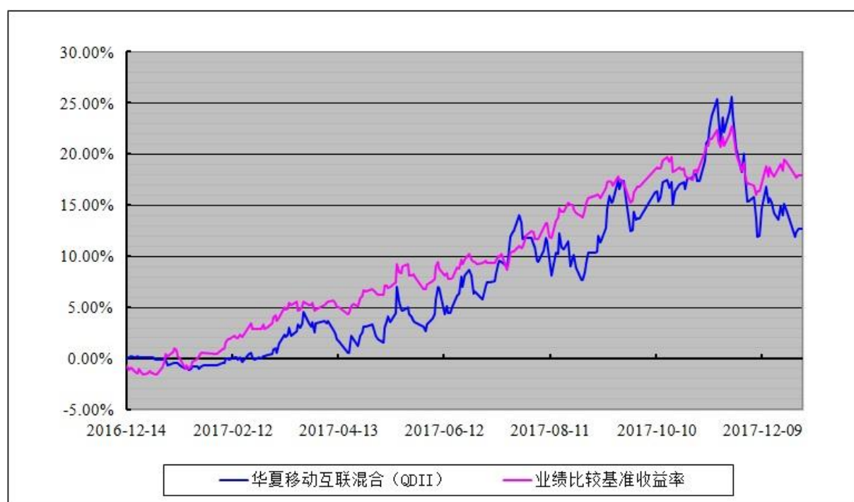
华夏移动互联灵活配置混合型证券投资基金（QDII） 份额累计净值增长率与业绩比较基准收益率历史走势对比图 (2016 年 12 月 14 日至 2017 年 12 月 31 日)

注：根据华夏移动互联灵活配置混合型证券投资基金（QDII）的基金合同规定，本基金自基金合同生效之日起 6 个月内使基金的投资组合比例符合本基金合同第十二部分“二、投资范围”、“四、投资限制”的有关约定。