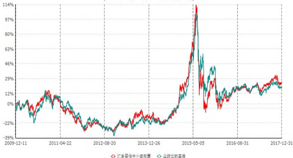
汇丰晋信中小盘股票型证券投资基金累计净值增长率与业绩比较基准收益率历史走势对比图 (2009年12月11日-2017年12月31日)