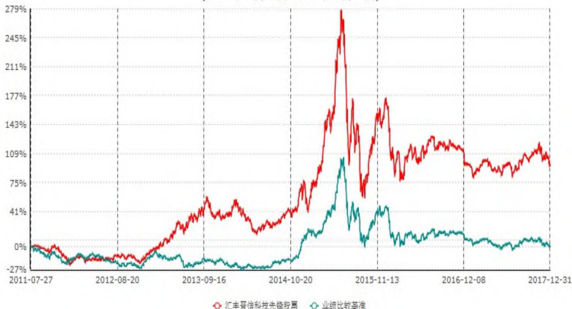
汇丰晋信科技先锋股票型证券投资基金累计净值增长率与业绩比较基准收益率历史走势对比图 (2011年07月27日-2017年12月31日)