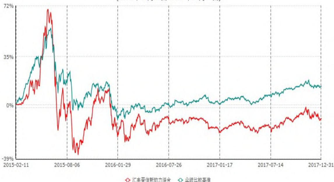
汇丰晋信新动力混合型证券投资基金累计净值增长率与业绩比较基准收益率历史走势对比图 (2015年02月11日-2017年12月31日)