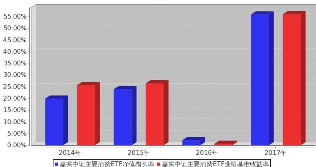
嘉实中证主要消费ETF基金每年净值增长率与同期业绩比较基准收益率的对比图

注：本基金基金合同生效日为2014年6月13日，2014年度的相关数据根据当年实际存续期（2014年6月13日至2014年12月31日）计算。