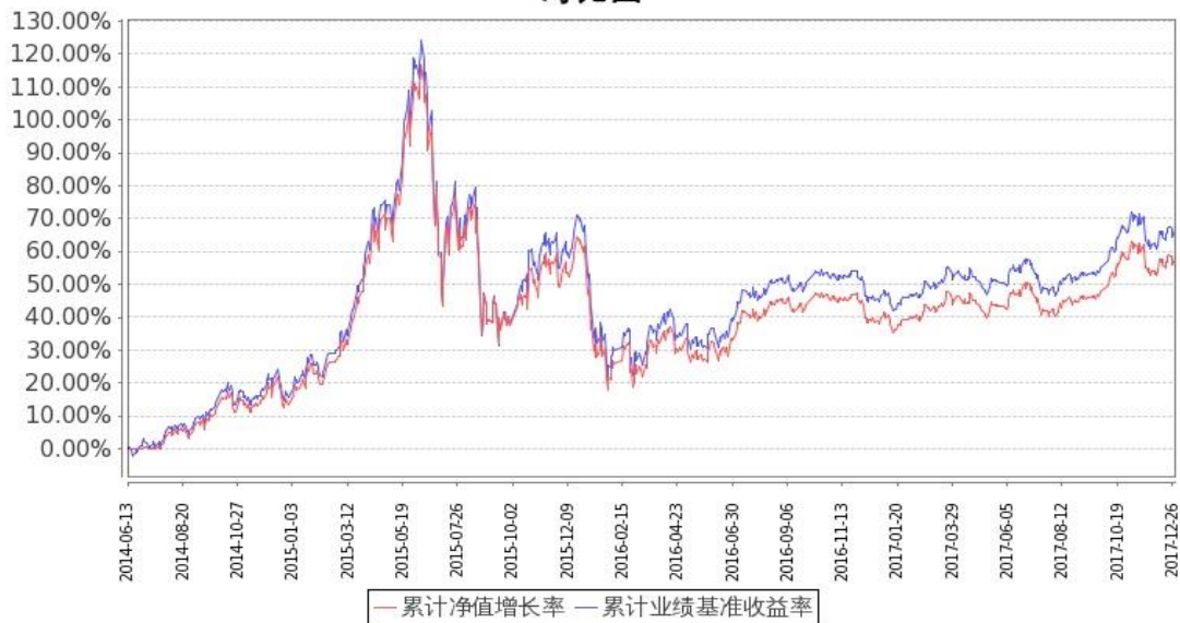
图：嘉实中证医药卫生 ETF 基金份额累计净值增长率与同期业绩比较基准收益率的历史走势对比图