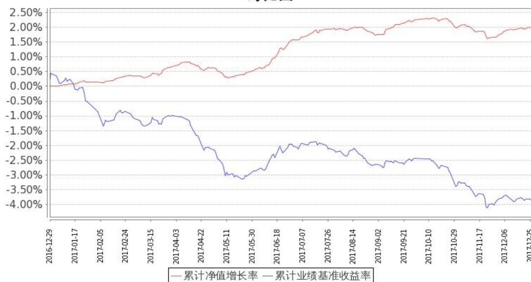
图：嘉实丰安6个月定期债券基金份额累计净值增长率与同期业绩比较基准收益率的历史走势对比图