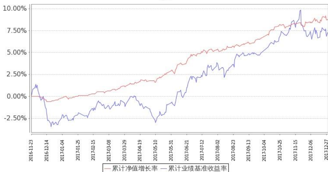
图：嘉实主题增强混合基金份额累计净值增长率与同期业绩比较基准收益率的历史走势对比图