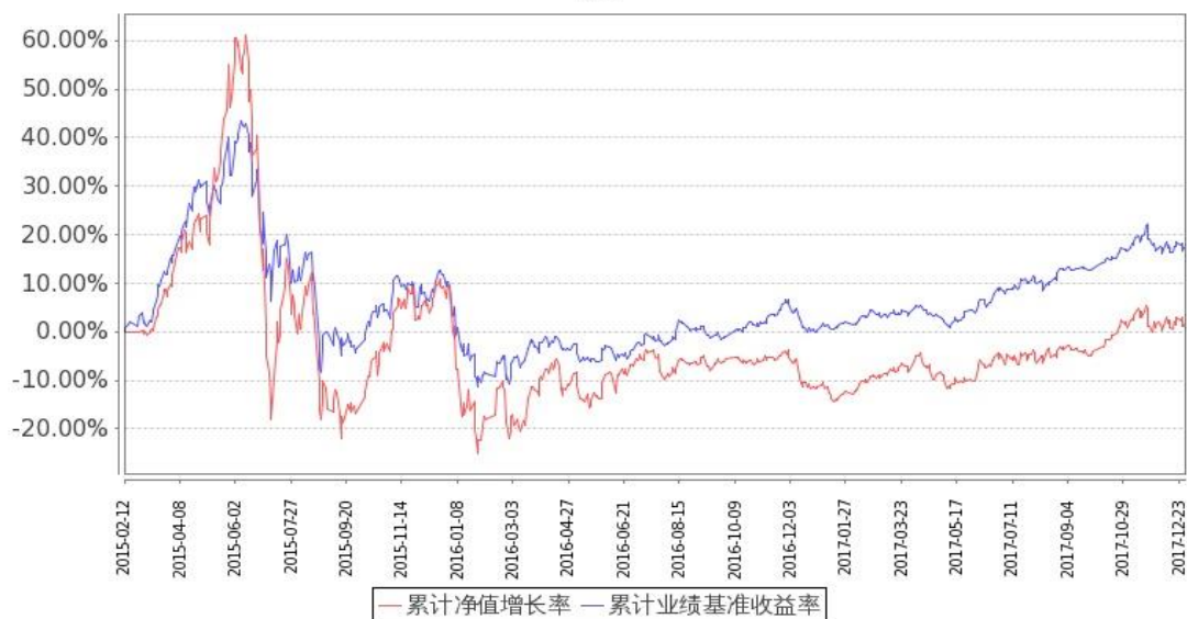
图：嘉实企业变革股票基金份额累计净值增长率与同期业绩比较基准收益率的历史走势对比图 (2015年2月12日至2017年12月31日)

注：1. 按基金合同和招募说明书的约定，本基金自基金合同生效日起6个月内为建仓期，建仓期结束时本基金的各项投资比例符合基金合同（十二（二）投资范围和（四）投资限制）的有关约定。