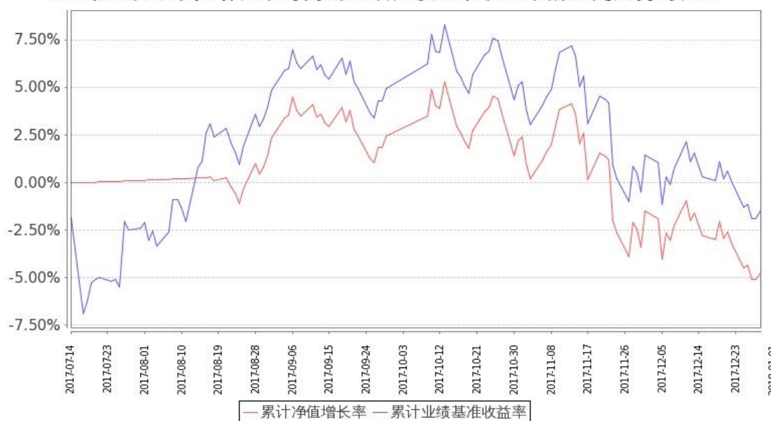
图：嘉实创业板 ETF 基金份额累计净值增长率与同期业绩比较基准收益率的历史走势对比图