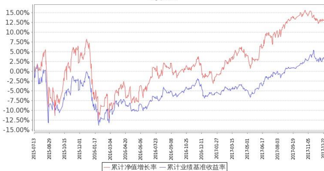
图：嘉实新机遇混合发起式基金份额累计净值增长率与同期业绩比较基准收益率的历史走势对比图