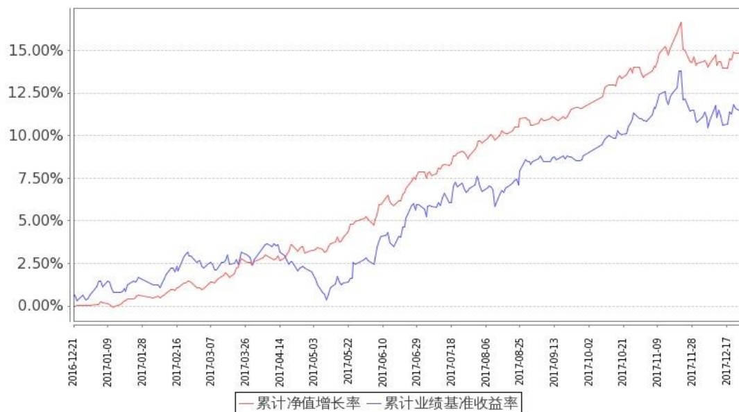
图：嘉实新添瑞混合基金份额累计净值增长率与同期业绩比较基准收益率的历史走势对比图 (2016年12月21日至2017年12月31日)

注：按基金合同和招募说明书的约定，本基金自基金合同生效日起6个月内为建仓期，建仓期结束时本基金的各项投资比例符合基金合同（十二（二）投资范围和（四）投资限制）的有关约定。