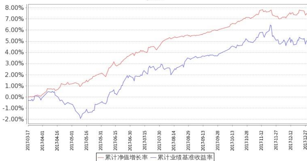
图：嘉实新添华定期混合基金份额累计净值增长率与同期业绩比较基准收益率的历史走势对比图 (2017 年 3 月 17 日至 2017 年 12 月 31 日)

注：本基金基金合同生效日 2017 年 3 月 17 日至报告期末未满 1 年。按基金合同和招募说明书的约定，本基金自基金合同生效日起 6 个月内为建仓期，建仓期结束时本基金的各项投资比例符合基金合同（十二（二）投资范围和（四）投资限制）的有关约定。