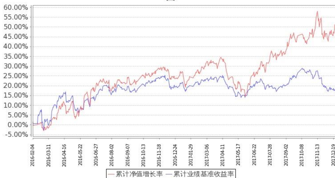
图：嘉实智能汽车股票基金份额累计净值增长率与同期业绩比较基准收益率的历史走势对比图