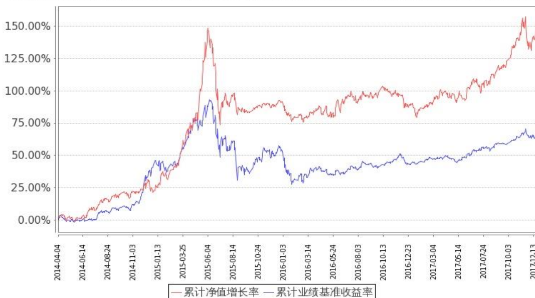
图：嘉实泰和混合基金份额累计净值增长率与同期业绩比较基准收益率的历史走势对比图 (2014 年 4 月 4 日至 2017 年 12 月 31 日)