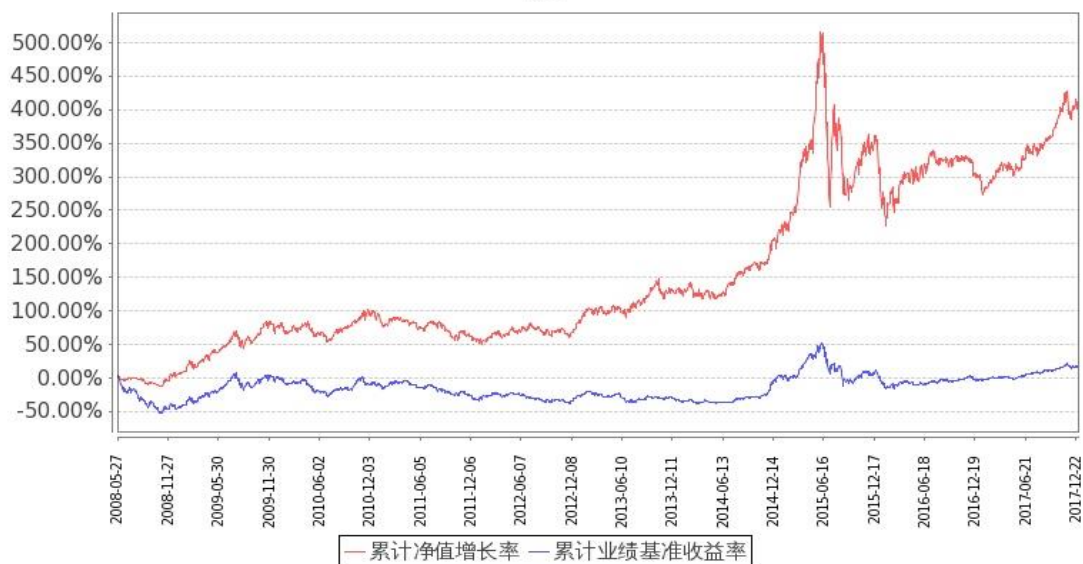
图：嘉实研究精选混合基金份额累计净值增长率与同期业绩比较基准收益率的历史走势对比图 (2008年5月27日至2017年12月31日)

注：按基金合同约定，本基金自基金合同生效日起6个月内为建仓期。建仓期结束时本基金的投资组合比例符合基金合同“十四、基金的投资（二）投资范围、（七）2. 投资组合比例限制”的约定。