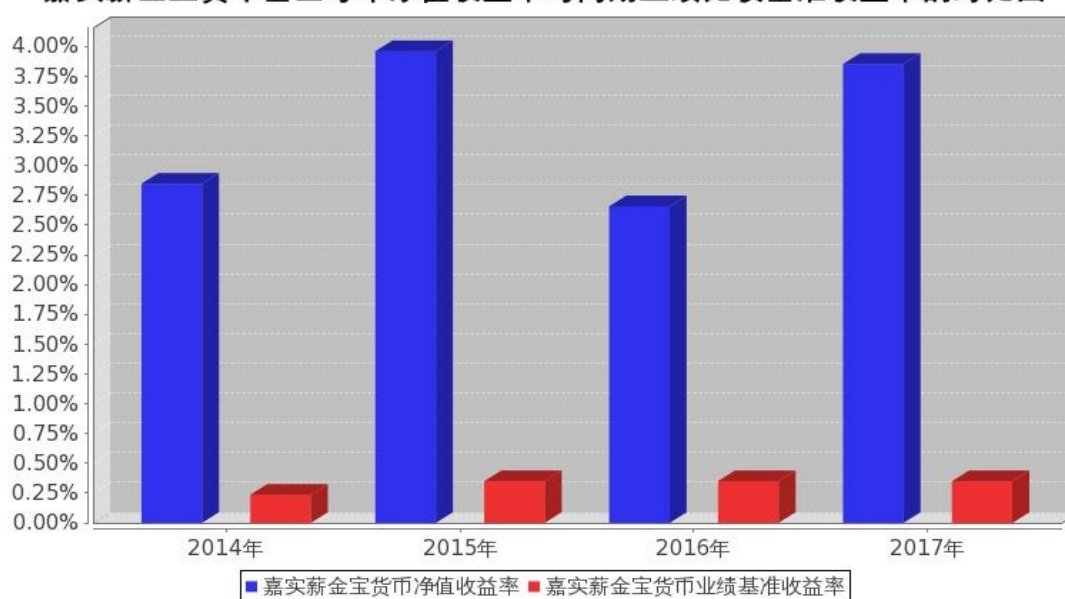
嘉实薪金宝货币基金每年净值收益率与同期业绩比较基准收益率的对比图

注：本基金基金合同生效日为 2014 年 4 月 29 日，2014 年度的相关数据根据当年实际存续期（2014 年 4 月 29 日至 2014 年 12 月 31 日）计算。