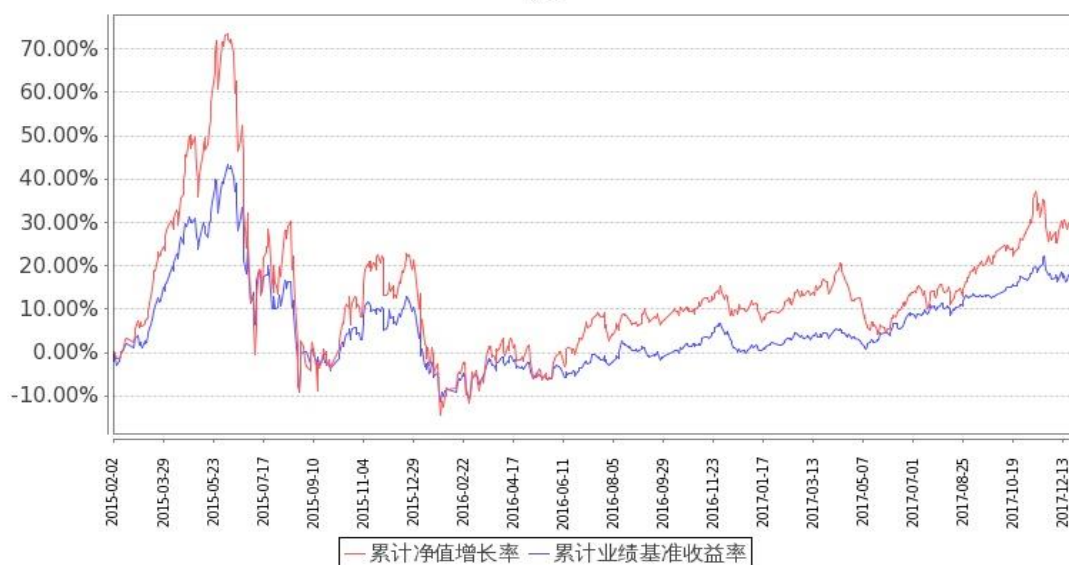
图：嘉实逆向策略股票基金份额累计净值增长率与同期业绩比较基准收益率的历史走势对比图 (2015年2月2日至2017年12月31日)

注：按基金合同和招募说明书的约定，本基金自基金合同生效日起6个月内为建仓期，建仓期结束时本基金的各项投资比例符合基金合同（十二（二）投资范围和（四）投资限制）的有关约定。