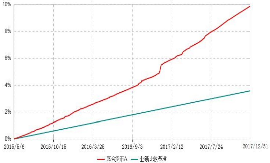
嘉合货币A累计净值收益率与业绩比较基准收益率历史走势对比图 (2015年05月06日-2017年12月31日)