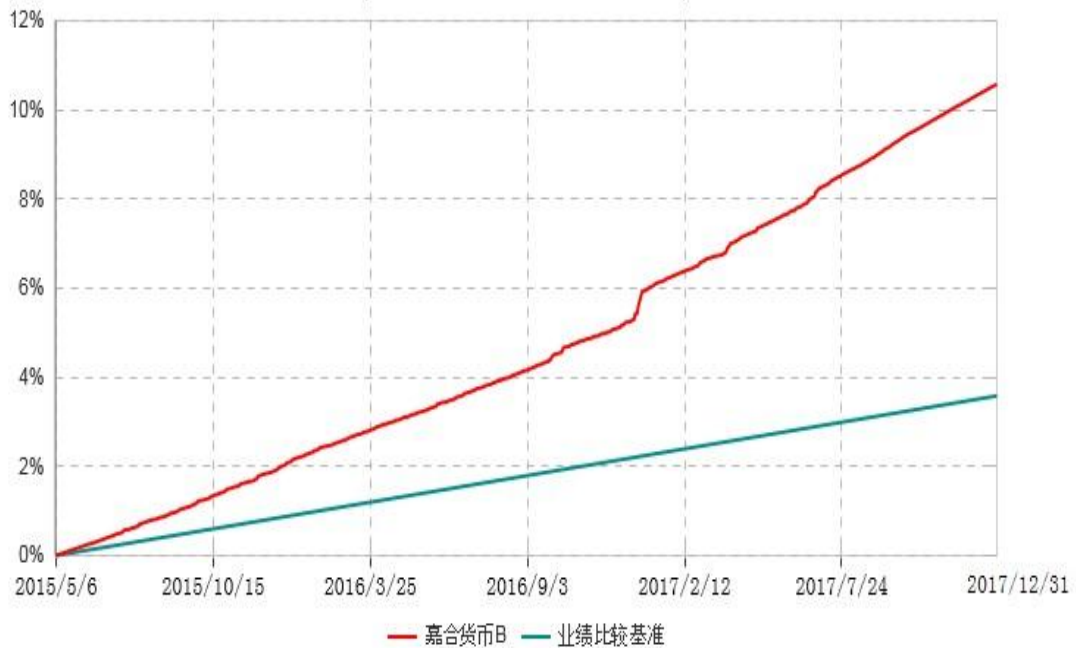
嘉合货币B累计净值收益率与业绩比较基准收益率历史走势对比图 (2015年05月06日-2017年12月31日)