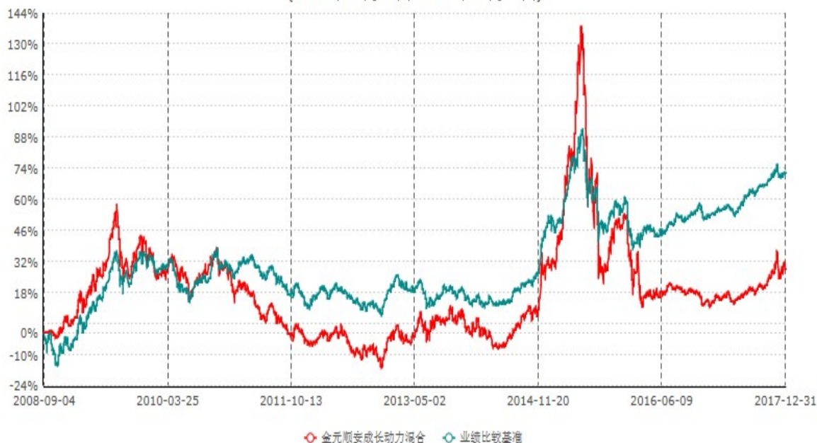
金元顺安成长动力灵活配置混合型证券投资基金累计净值增长率与业绩比较基准收益率历史走势对比图 (2008年09月03日-2017年12月31日)