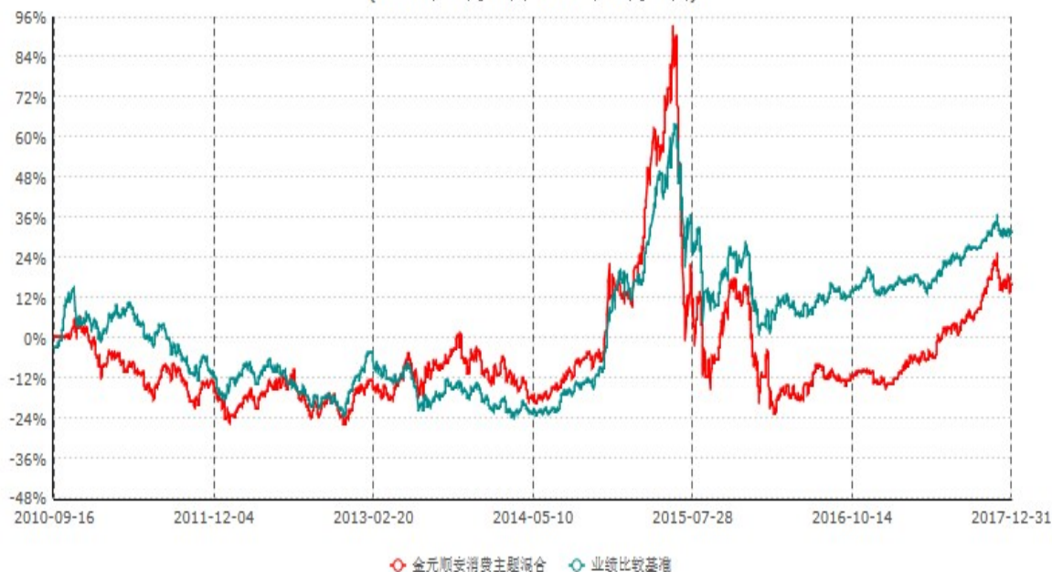
金元顺安消费主题混合型证券投资基金累计净值增长率与业绩比较基准收益率历史走势对比图 (2010年09月15日-2017年12月31日)