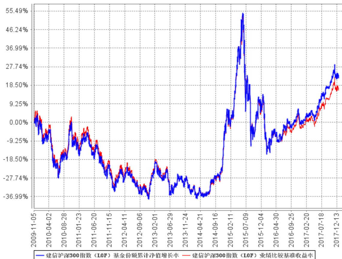
建信沪深300指数 (LOF) 基金份额累计净值增长率与同期业绩比较基准收益率的历史走势对比图