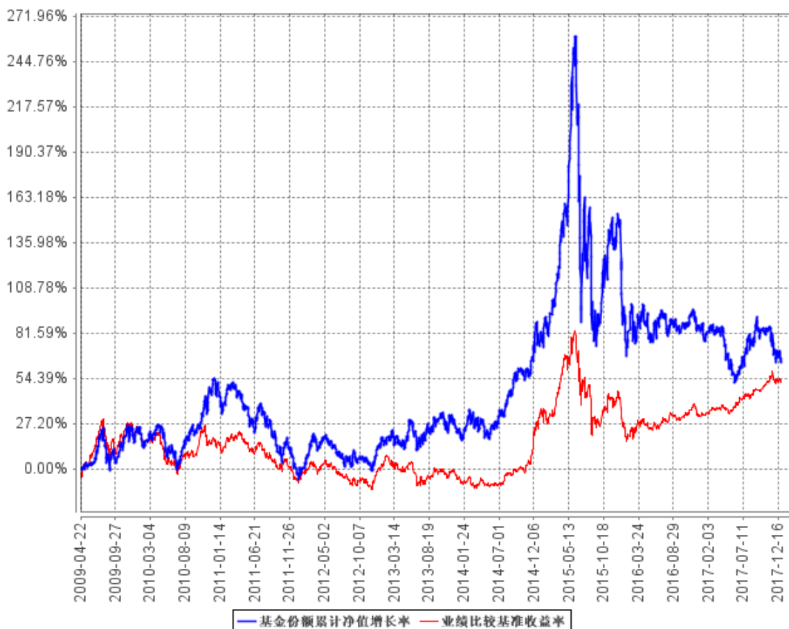
基金份额累计净值增长率与同期业绩比较基准收益率的历史走势对比图

注：1、本基金基金合同于 2009 年 4 月 22 日正式生效。 本基金自 2015 年 8 月 7 日起变更为混合型基金。