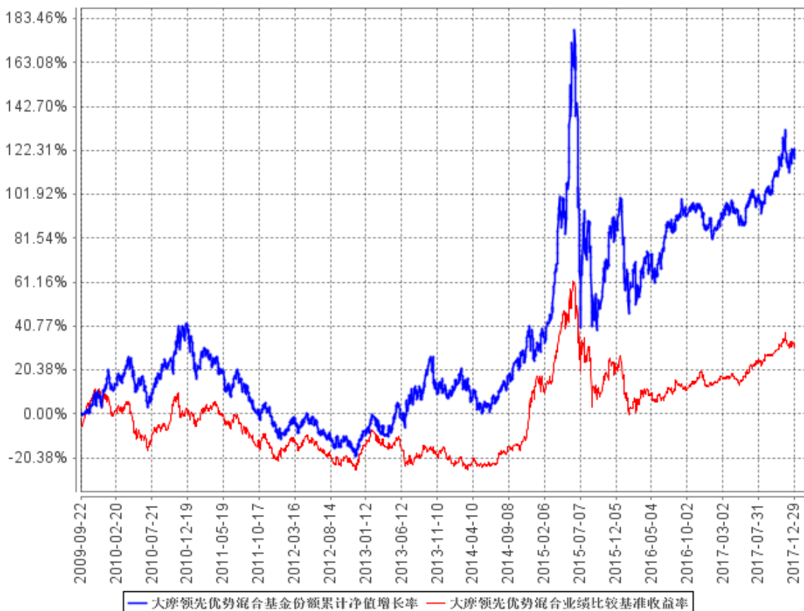
大摩领先优势混合基金份额累计净值增长率与同期业绩比较基准收益率的历史走势对比图