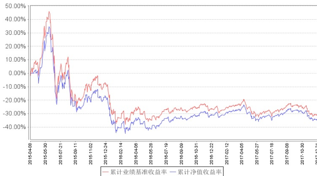
南方中证500工业ETF累计净值增长率与同期业绩比较基准收益率的历史走势对比图