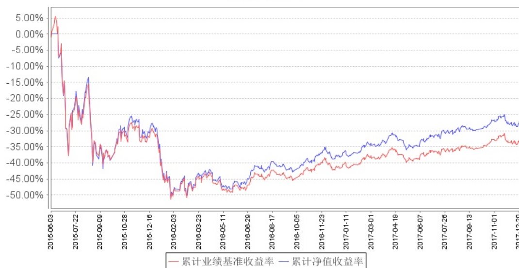
南方中证国有企业改革指数分级累计净值增长率与同期业绩比较基准收益率的历史走势对比图