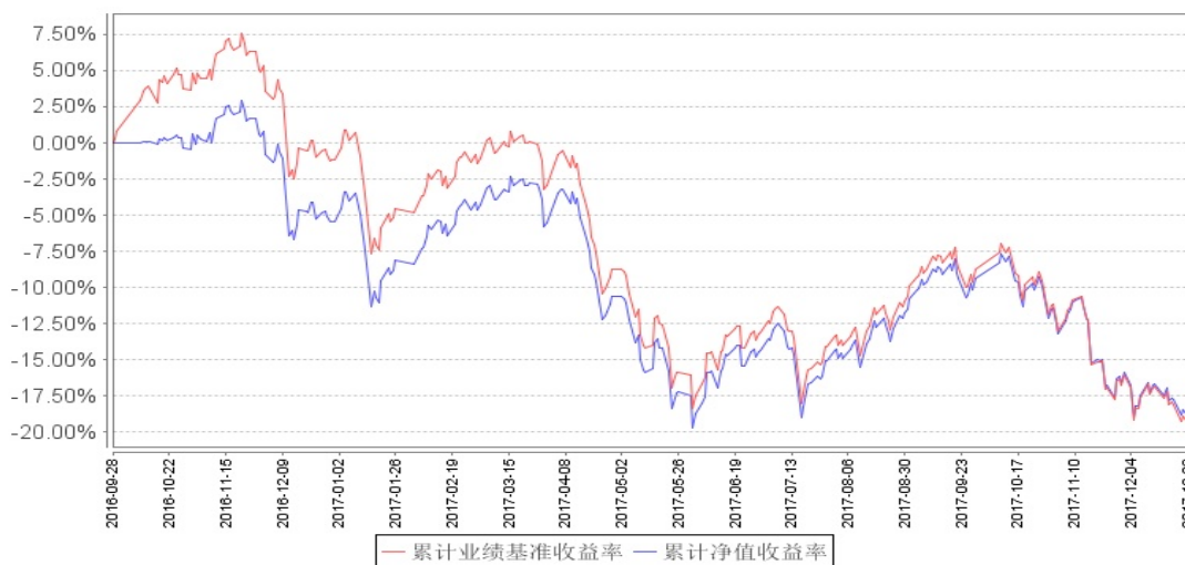
南方中证1000ETF累计净值增长率与同期业绩比较基准收益率的历史走势对比图