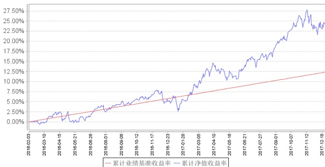
南方君选灵活配置混合累计净值增长率与同期业绩比较基准收益率的历史走势对比图