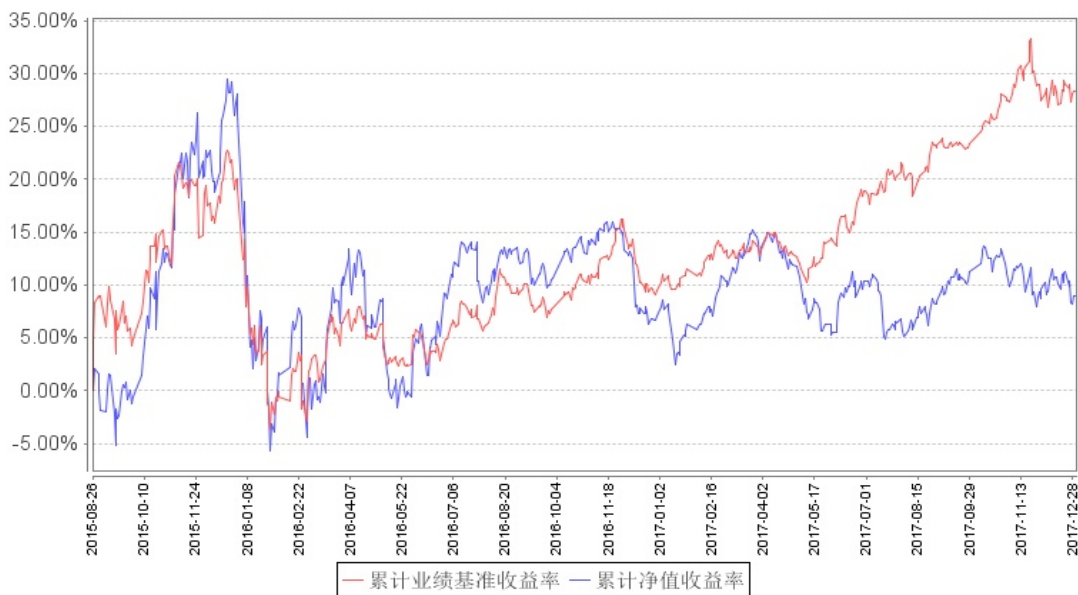
南方国策动力股票累计净值增长率与同期业绩比较基准收益率的历史走势对比图