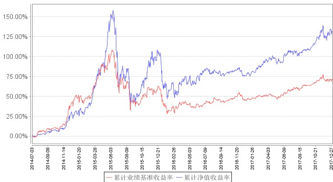
南方天元新产业股票累计净值增长率与同期业绩比较基准收益率的历史走势对比图